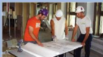
Les équipes sont à pied d'œuvre pour la construction du Centre