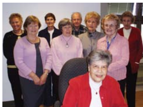
Des membres des Auxiliaires de l'Hôpital général du Lakeshore

Si vous désirez offrir vos services bénévoles à la Fondation HGL, veuillez communiquer avec notre bureau au 514-630-2081 ou par courriel à benevole@fondationlakeshore.ca.