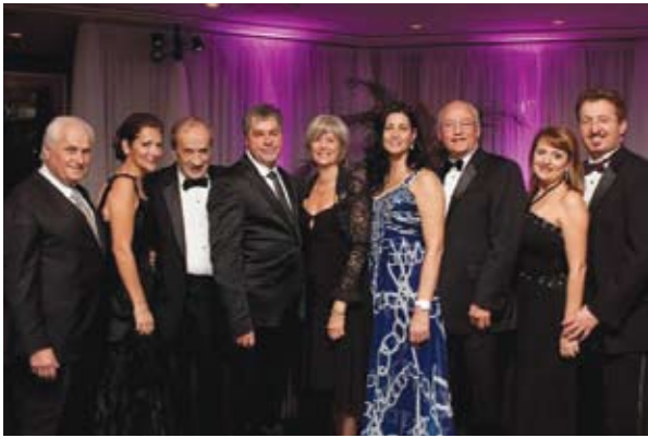
Des participants au bal, incluant l'honorable Yves Bolduc, ministre de la Santé (centre gauche), se rassemblent pour la photo